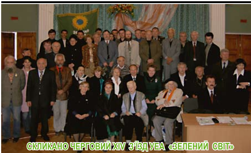
СКЛИКАНО ЧЕРГОВИЙ XIV З'ЇЗД УЕА «ЗЕЛЕНИЙ СВІТ»

Відповідно до Статуту УЕА «Зелений світ», головою Асоціації «Зелений світ» скликано черговий XIV з'їзд Асоціації 19 грудня 2013 року в м. Києві, (вул. Л.Толстого, 7) об 11 годині.