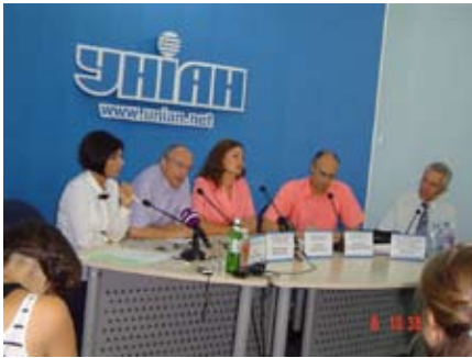
Початок на ст. 1