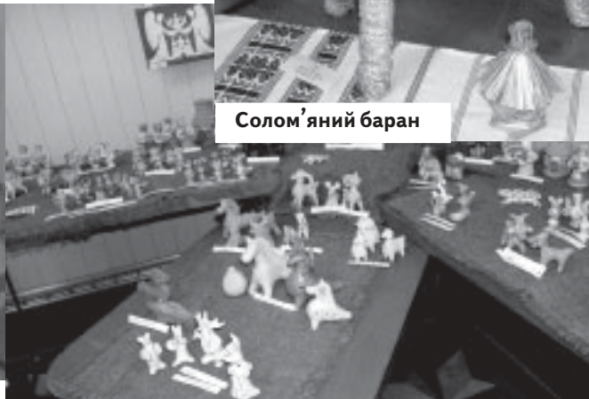
Глиняні вироби дитячого гуртка "Гончарик"