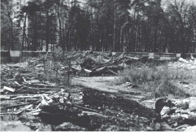
Руїни після військовиків у мирний час на цивільному фронті. Вул. Львівська, 15, Київ

На сторінках нашої газети друкувався матеріал про героїчні операції українських військових, скоєні на цивільному фронті. Продовжуємо згадану тему.