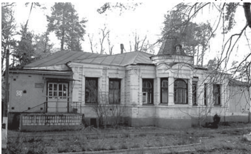
Дачний будиночок полковника Івана Мировича, нащадка гетьманських родів Полуботка і Самойловича, приречений на знищення Міністерством оборони

Тут мені на думку спала стара байка. Одної лихої ночі до господи чоловіка попросився перехожий, мовляв замерзаю і таке інше. Господар погодився — пустив незваного гостя, нагодував, постелив біля печі. На ранок зайдая заявляє, що буде тут