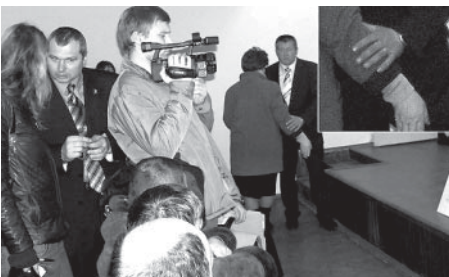
Військові "герої" у цивільному застосовують силу до місцевих жінок

А впливає це з того, що здоровий глузд на цьому зібранні відпочивав. Посудить самі, збори про доцільність забудови хмарочосами рекреаційної території столиці проводяться не серед мешканців, які близько цієї території проживають, а в середовищі забудовників. А чому тут повинні стояти житлові будинки? Чому б тут, в оздоровчій зоні Києва, не збудувати сміттєспалювальний комбінат? Привезти до приміщення ЖЕКу працівників сміттевої галузі та аргументувати доцільність спорудження заводу че-