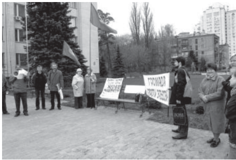
Пікетування громадськістю сесії Святошинської райради Києва з вимогою провести справжні громадські слухання

ратури, до Президента України, до інших інстанцій. Головне управління охорони культурної спадщини КМДА склало Припис про зупинку робіт, які призвели до знищення понад половини об'єктів культурної спадщини Києва. Міністерство оборони припис ігнорувало. Ми вирішили, що Єханурову не доповіли про цей факт, разведка ж працює бездоганно, і пропікетували Міноборони, передавши для міністра його генералом Звернення громадськості та копії Приписів. Це також не вплинуло на „доблесних українських воєнів”. Згодом, ми прийшли під Кабінет Міністрів та передали для прем'єра Звернення, щоб остання вгамувала хижацькі апетити Міністра оборони.