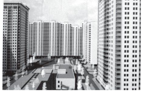
На місці залишків реліктового лісу виростає військовий(?) масив хмарочосів. Проект

У святошинському реліктовому лісі традиційно розміщувалися рекреаційні заклади. Так, на початку минулого сторіччя там були дачі киян та оздоровниці. Академік Ігор Юхновський, директор Інституту національної пам'яті, запевняє, що у Святошині любив лікуватися та відпочивати Президент України Михайло Грушевський, і саме на тому місці, де донедавна розміщувався військовий