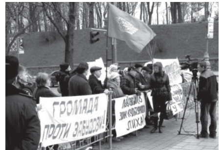
Пікетування громадськістю Кабінету Міністрів України з вимогою припинити свавілля Міністра оборони України

Та у наші дні 2004 року шпиталь ліквідували, але земельку військовики не покинули, встановивши там камуфляжну охорону. Довго військові тримали земельку наче в резерві, аж поки у 2007 році не отримали Державного акту на постійне користування цією землею. У цьому ж році „освободітелі” почали „освобождати” територію від реліктових дерев. Владні похоронці довкілля столиці навіть дали їм ордери на знищення 71 дерева, буцімто аварійних. Під цю дудочку „славні військовики” вирізають під пень близько двох гектарів залишків лісу. По-