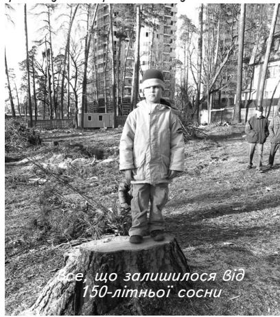
Все, що залишилося від 150-літньої сосни

Київ перетворився на велике поле битви. У поле (з міста-парка) Київ перетворюють за сприяння пожадливої міської влади забудовники, які, немов сарана, обсіли кожен незабудований клаптик столичної землі. Причому битва має жертви не лише з боку природи. Під час штурму мешканцями будинку №59 на вул. Львівській паркана забудовників, коли останні розпочали масово знищувати вікові дерева, з-за паркана в бік місцевих жителів лунали постріли і газові атаки.