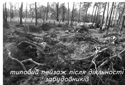
типовий пейзаж після діяльності забудовників

Жителі прилеглих будинків одностайно переконані, що новобудови під їхніми вікнами не лише порушують їхні конституційні права на чисте екологічне довкілля, але й загрожують безпеці їхнього життя і здоров'я, оскільки будинки мікрорайону розташовані у зоні суціль-