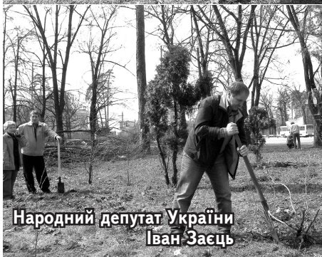
Народний депутат України Іван Заєць