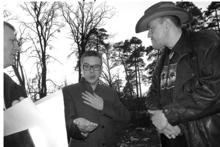
представник забудовника (в центрі) пояснює представникам районної влади, хто фальшував державні документи

Близько півсотні корабельних вікових сосен та майже 200-літніх дубів вирізали забудовники на ділянці, меншій від 1 га, на перетині вулиць Львівської та Живописної в українській столиці.