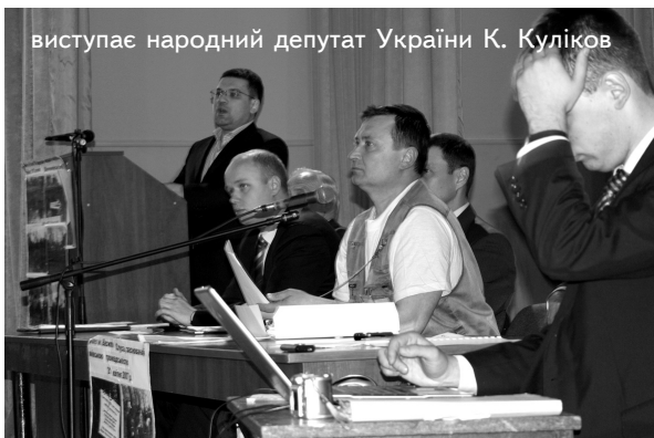
виступає народний депутат України К. Куліков

вописної. Організатором слухань виступили Святошинські районні організації Української народної партії та „Зелений світ”. Районна влада посприяла проведенню громадських слухань, надавши приміщення районного будинку культури.